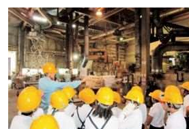
ものづくり事業所等見学