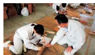
工業高校における実技指導（建築大工）