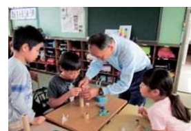
ものづくり体験教室（万華鏡づくり）