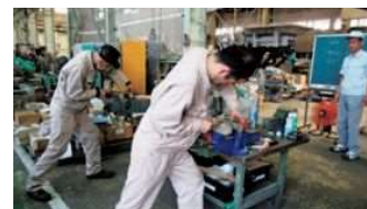
企業における実技指導（仕上げ）