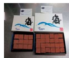
トリュフ及び生チョコ