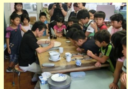
③マイスターによる実演