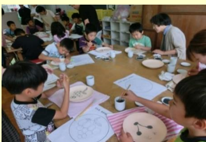
④ものづくり体験(約1~2時間) ※体験は、マイスターが個別指導します