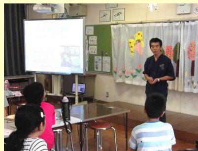
②マイスターによる講話