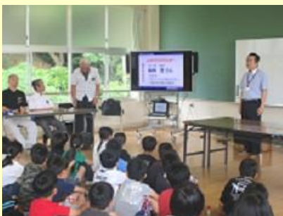
①趣旨説明とマイスター紹介