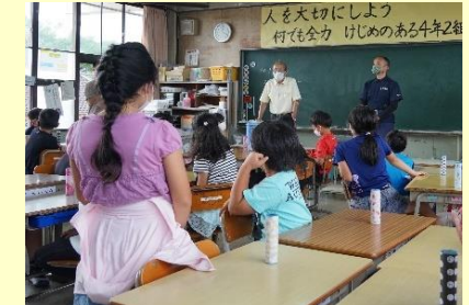
⑤質問コーナーやアンケート記入