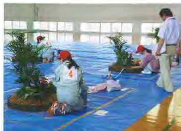
室内園芸装飾作業3級技能検定試験風景

職業能力開発促進法に基づいて働く人の技能を一定の基準によって検定し、これを公証する国家検定制度です。検定の級は、特級、1級、単一等級、2級、3級、基礎級、随時3級（基礎級及び随時3級は、外国人技能実習生対象）に区分して全国統一の試験問題で行われます。技能検定は、実技試験と学科試験があり両方に合格した人に、それぞれの級にしたがって「技能士」の称号が与えられます。