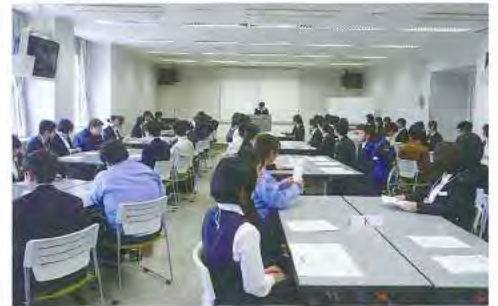
新入社員研修の様子