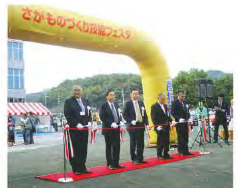
さがものづくり技能フェスタ・オープニングの様子