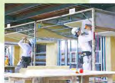
ボード仕上げ作業技能検定試験風景